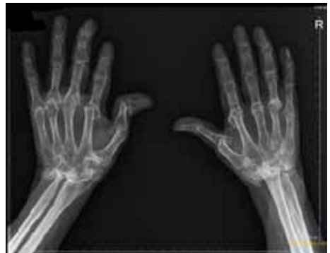
RX van handen met vergevorderde RA

Op een röntgenfoto is te zien of een gewricht is beschadigd. Meestal is dit pas te zien in een later stadium van de ziekte, maar bij agressieve vormen van reumatoïde artritis ook in het begin.