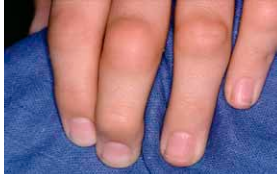
warme en gezwollen gewrichten

Als de ontsteking pas begonnen is, is de zwelling soms nog niet zo duidelijk. Je merkt bijvoorbeeld pijn onder de bal van je voeten bij het lopen, je hebt last van stijve vingers of opgezette handen.